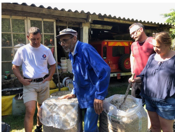
Texte : Stan-Yves Bontems

Pour plus de détails, nos adhérents peuvent me contacter à MPF 79. Stan-Yves Bontems.