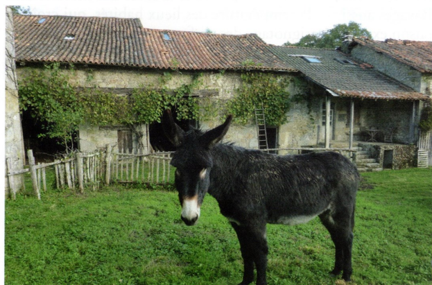
L'entour des habitations n'est plus guère fréquenté par les animaux...

Dans la mare, en face, toute une faune venait boire entre les joncs à massettes sur lesquels montaient les larves de libellules. On y pataugeait pieds nus dans la vase et on pêchait sous les