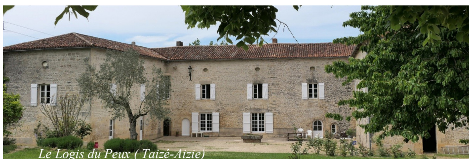
Le Logis du Peux (Taizé-Aizie)

Ensuite, nous avons rejoint le logis du Peux (Taizé-Aizie), un logis en U magnifiquement restauré qui domine les coteaux de la Charente et, pour finir, nous avons visité un dernier logis près de l'ex. RN10. Ce logis d'origine du XV e siècle a conservé pratiquement intacte sa façade arrière avec ses fenêtres à barreaux de fer en défense. A la fin de la journée : retour à la salle des Adjots pour le traditionnel pot de l'amitié avec dégustation d'un produit local.