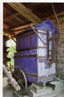
Petit bazar du matériel agricole début XX e siècle. Musée de Montaigut (Aveyron)