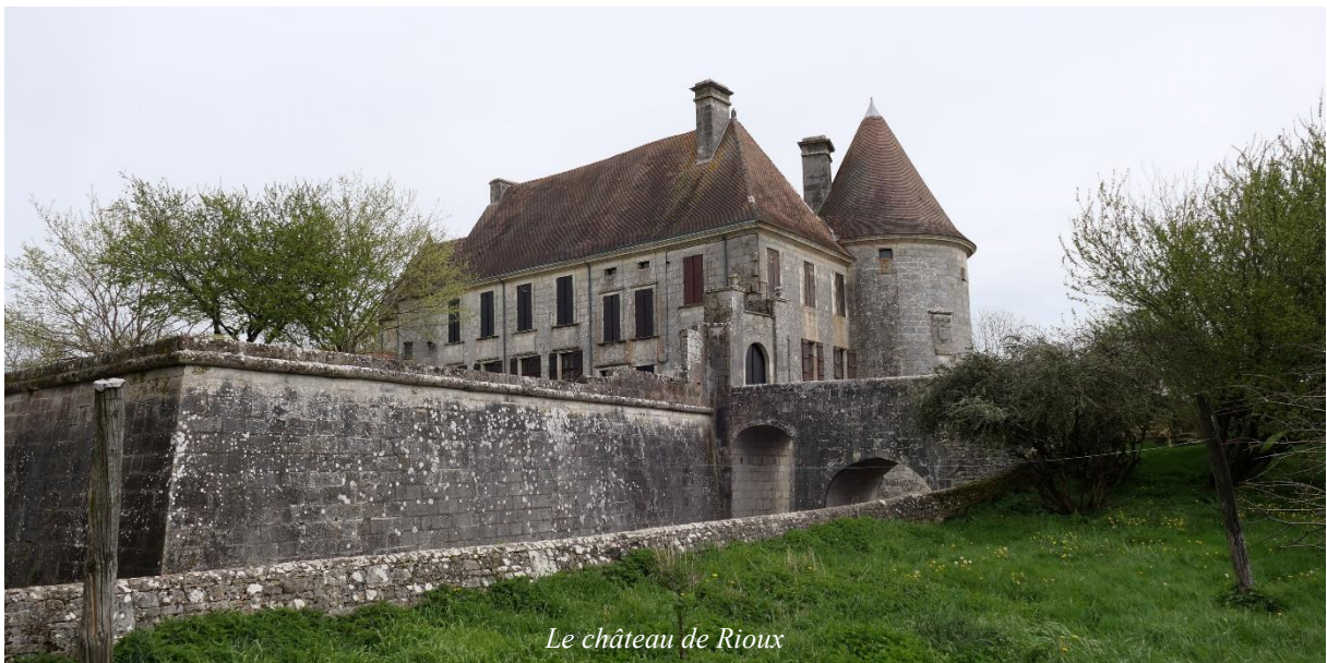
Le château de Rioux