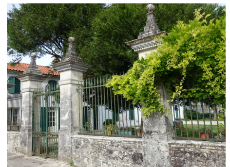
Logis de Chaban