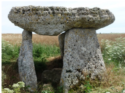
Dolmen de la Pierre levée à Ardillières

51 rue de la Garousserie - Les Granges 17400 Saint Jean d'Angély 06 56 71 44 74 - 05 46 32 03 20 charente-maritime@maisons-paysannes.org (ouvert le mercredi après-midi).