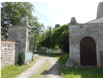
Entrée, une partie des communs et puits de ce bel ensemble privé.

A l'impasse suivante, bien que privée, une belle entrée avec sa porte piétonnière ouvre sur une cour entourée d'une belle maison de maître, de ses communs et d'une autre maison plus sobre.