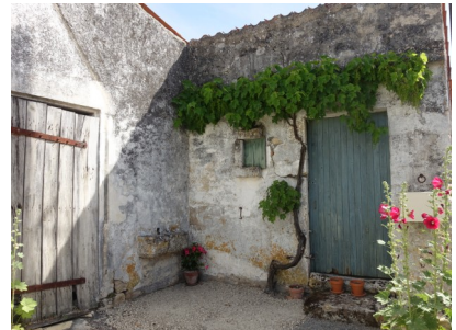
Jolie petite entrée de maison

A l'impasse suivante, bien que privée, une belle entrée avec sa porte piétonnière ouvre sur une cour entourée d'une belle maison de maître, de ses communs et d'une autre maison plus sobre.