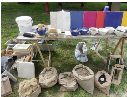
Balade contée et stand Stéphane Montagne.