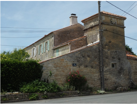
Pigeonnier à Ardillières