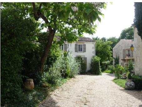
Maison et balet à Landrais