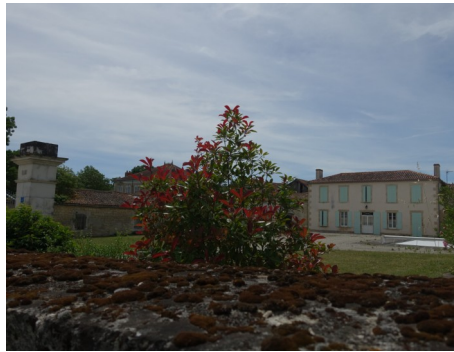
Domaine du Bois Des Mottes