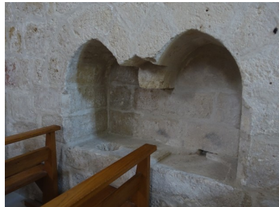
L'église et sa fontaine liturgique