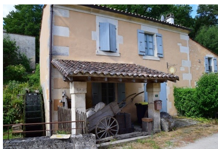
Petite maison et moulin de « Chez Gauthier »