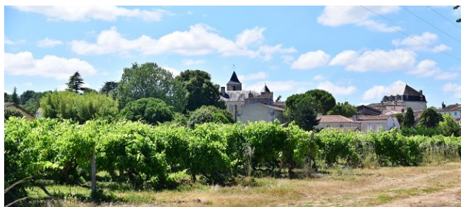
Vue générale de Burie

Journal de la délégation 17 - N° 3 - septembre 2017