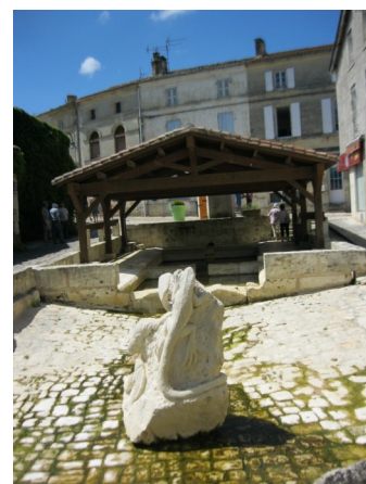
Lavoir de Burie