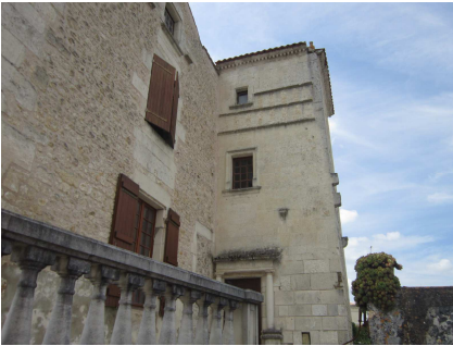
Maison de 1559

Direction « Le Chatelard », pour la visite des bâtiments de ferme comprenant entre autres une imposante grange. Le propriétaire nous conduit ensuite dans la cour du château et nous explique l'historique du château et de ses différents occupants. Cette construction sur trois niveaux des XV ème et XX ème siècles forme un bel ensemble renaissance en limite des marais de la Seudre.