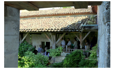
La commanderie des templiers

Nous partons pour le domaine de « La Groie », propriété viticole, où les propriétaires nous accueillent chaleureusement, en nous expliquant les différentes modifications effectuées sur les bâtiments, entre autres, une élégante grille qui ferme la cour. Nous acceptons une dégustation de pineau de leur production, avant de nous rendre sur la place de Meursac, lieu de notre pique-nique.