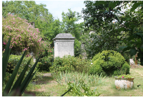
Puits en pierre de taille