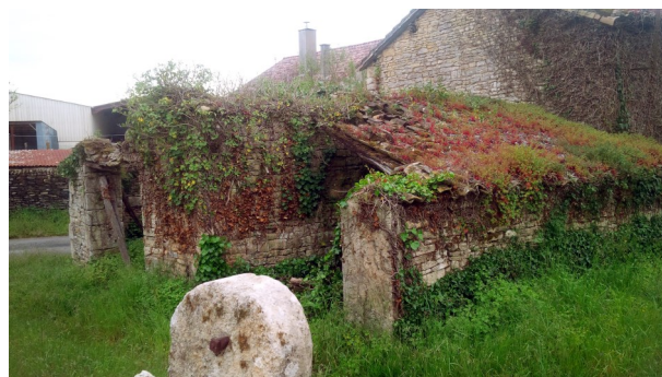
Photo d'ensemble, vue de la cour intérieure.