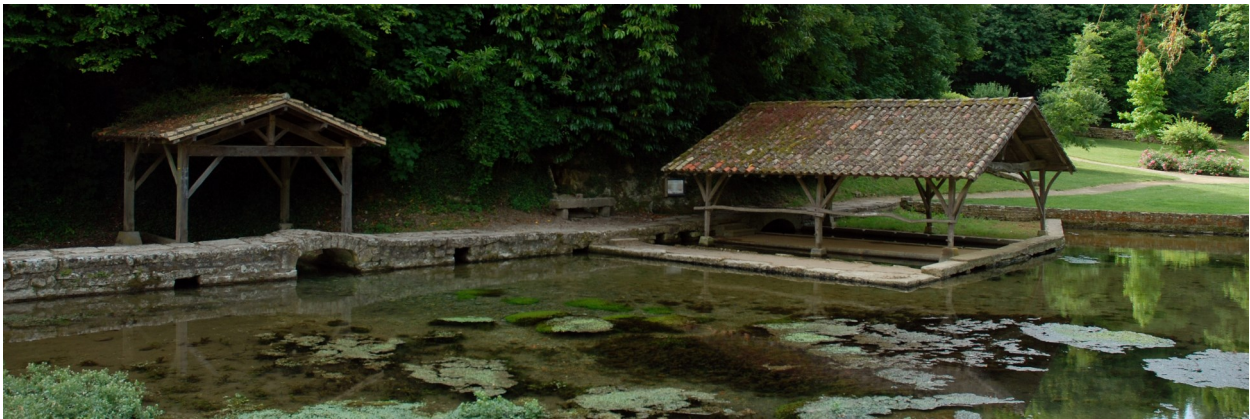
Fontaine et un des lavoirs de Sompt sur la rivière "La Somptueuse".