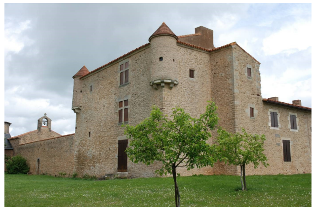
Le logis de Barroux vu du parc.

A l'intérieur, les pièces du rez-de-chaussée, du premier et du deuxième étage ont des cheminées à coffre ; deux d'entre elles portent encore des peintures. Les tourelles d'angle qui possèdent des mâchicoulis et des meurtrières pour armes à feu en assuraient la défense. Ce fief qui relevait du duché de Thouars est signalé dans les archives depuis 1398, propriété alors d'un certain Aimery de Barro. Le nom de Barroux, que l'on devrait écrire Barrow, vocable d'origine anglaise, désignait un tumulus ou un tombeau.