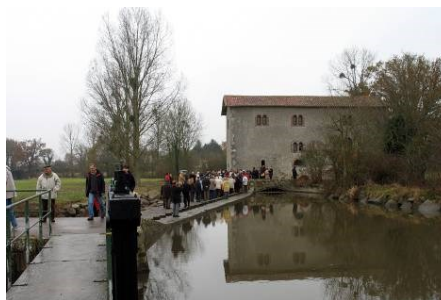
Le moulin dans son environnement.