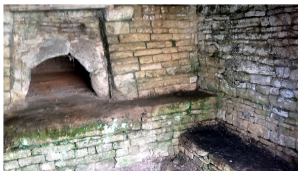
Intérieur du four, côté droit.