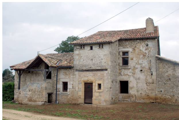
Le logis tel qu'il se présentait lors de notre visite.

Situé sur une partie argileuse du plateau, ce beau logis a été sorti de l'oubli après des travaux importants effectués par les propriétaires, tant à l'extérieur qu'à l'intérieur, ainsi que sur les bâtiments agricoles. Au vu des différentes surfaces d'eau restant autour du logis, on peut supposer que celui-ci fut construit sur une motte féodale. L'ensemble actuel paraît en grande partie dater des XV e - XVI e siècles. Une tour disparue permettait l'accès aux étages de cette maison forte. L'escalier à balet extérieur semble avoir été rajouté après la disparition de la tour afin de desservir à nouveau les étages.