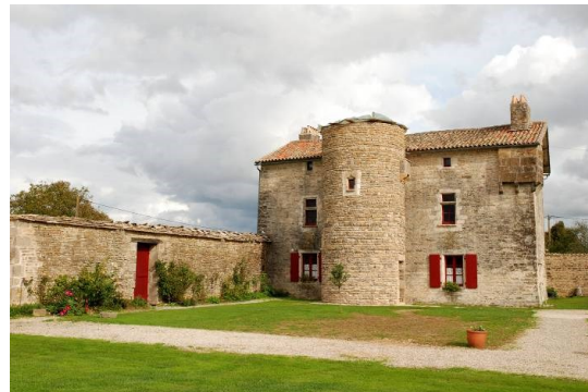
Le logis avant et après l'ajout de la tour qui contient un escalier en vis pour desservir les étages. (Sur la photo de droite, la toiture installée depuis la prise de vue, n'apparaît pas)