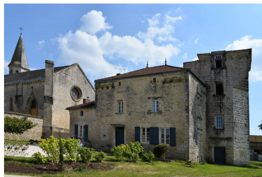
Bel ensemble, près de l'église, avec une curieuse tour au sommet carré sur une base octogonale.

Sortie du 7 septembre 2019 : LA PEYRATTE