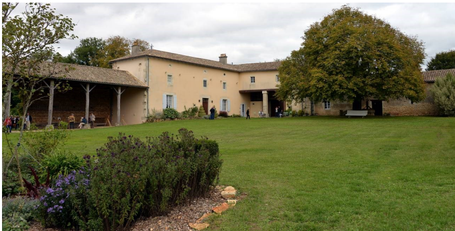
L'immense cour de ferme est maintenant fleurie et aménagée en parc.

Le village de Lapiteau est situé en limite de la Vienne et des Deux-Sèvres. Nous découvrons un bel ensemble de bâtiments remarquables par leur qualité architecturale, leur taille et surtout leur restauration fidèle à tous les principes énoncés par Maisons paysannes de France. Cet ensemble est mis en valeur par un environnement végétal (jardin, parc, verger, ...) reconstitué par Madame Lacroix.