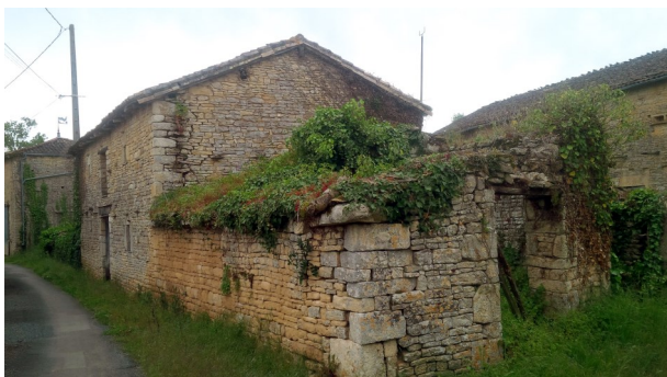
Photo d'ensemble, vue de la rue.