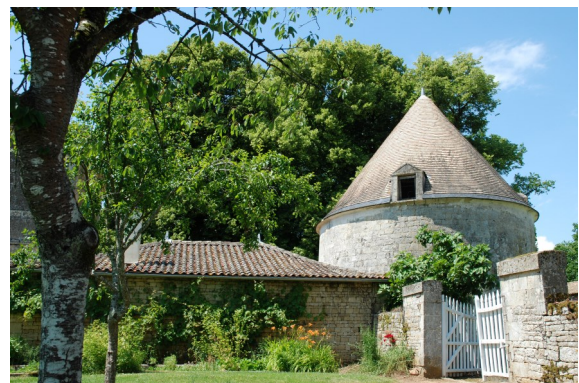
Pigeonnier au château des Ouches.

Sortie du 24 octobre 2014 : SAINT-MAXIRE