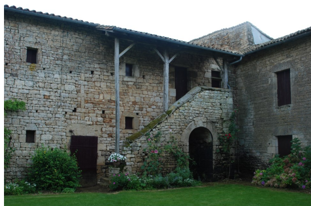
Le très beau logis de Villermat et les communs avec un bel escalier extérieur.

Le logis de Villermat semble dater du XV e . Il a gardé sa toiture à forte pente, avec ses souches de cheminées massives en pignon et sa tour d'escalier à six pans en façade. La porte d'entrée est décorée d'un arc à accolade. Les communs qui ferment pratiquement la cour ont conservé de très beaux éléments : fenêtres et escalier extérieur.