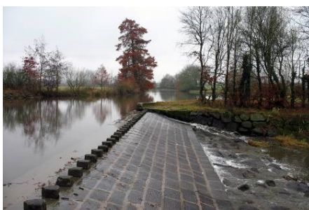
Le déversoir avec les "petits bonshommes".