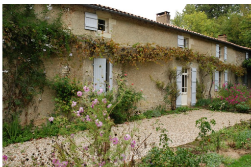
La façade arrière de la maison de Mme Castiel agréablement fleurie et décorée.