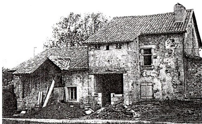
Le logis lors de l'acquisition par les propriétaires.