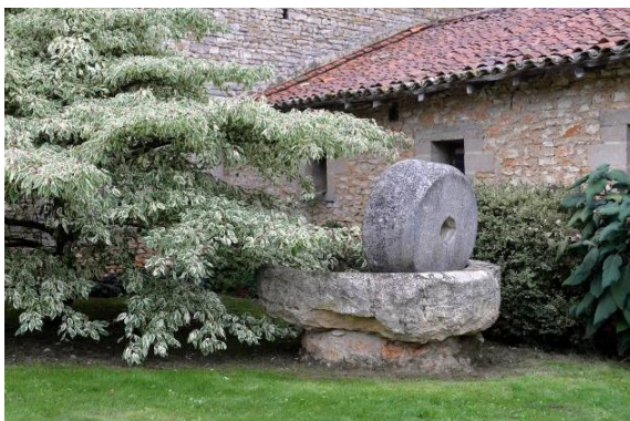
Vestiges d'un moulin à huile.