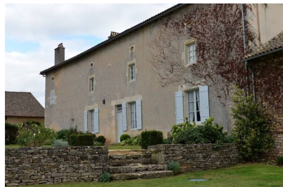
Autre façade du logis.