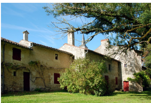
Très beau logis, au cœur du village.