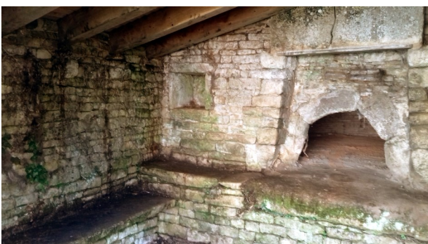
Intérieur du four, côté gauche.

Dans ce four, il y avait encore de la cendre. La dernière fois qu'il a fonctionné, c'était pour le mariage de ma mère en 1956.