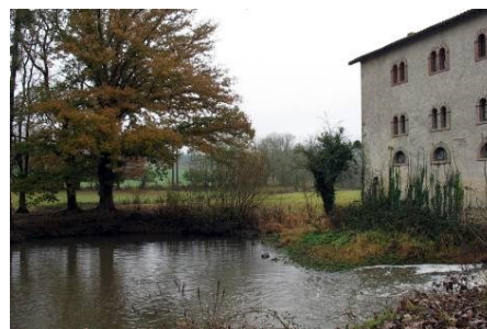
Un rayon de soleil aurait donné à ce paysage un charme certain.