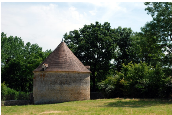
Pigeonnier au lieu-dit "Le Couvent" à Puyberland (XVII e s.) -