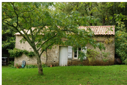
Charmante dépendance dans le parc.