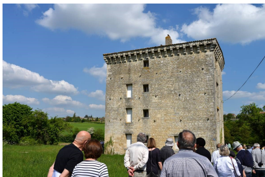
Le Bas Gournay : la tour carrée.

Le village de Gournay s'étale sur et en bas d'une colline. Au bas de Gournay s'élève une tour, haut édifice de forme carrée au sommet crénelé et qui semble dater du XIV e siècle.