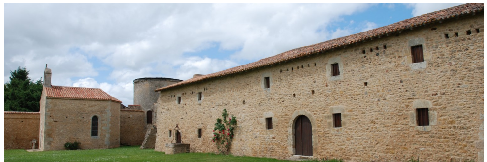
A l'intérieur de la cour fermée, la chapelle, une ancienne tour et une partie des bâtiments avec de nombreux trous de boulins pour les pigeons.

A l'intérieur, les pièces du rez-de-chaussée, du premier et du deuxième étage ont des cheminées à coffre ; deux d'entre elles portent encore des peintures. Les tourelles d'angle qui possèdent des mâchicoulis et des meurtrières pour armes à feu en assuraient la défense. Ce fief qui relevait du duché de Thouars est signalé dans les archives depuis 1398, propriété alors d'un certain Aimery de Barro. Le nom de Barroux, que l'on devrait écrire Barrow, vocable d'origine anglaise, désignait un tumulus ou un tombeau.