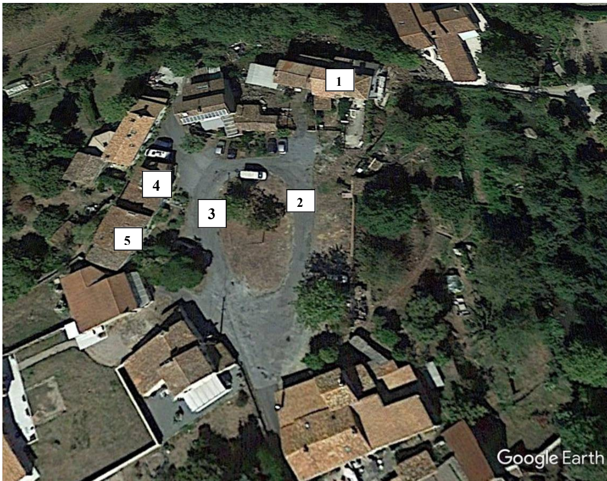
Sur cette vue aérienne de La Trébesse, la place principale du village où nous avons admiré les maisons les plus anciennes et les plus représentatives de l'architecture rurale de cette partie de la Gâtine.