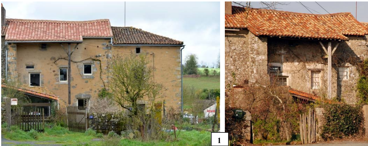
Cette maison possède un escalier extérieur avec auvent. Sur la photo de droite, la maison en 2014.