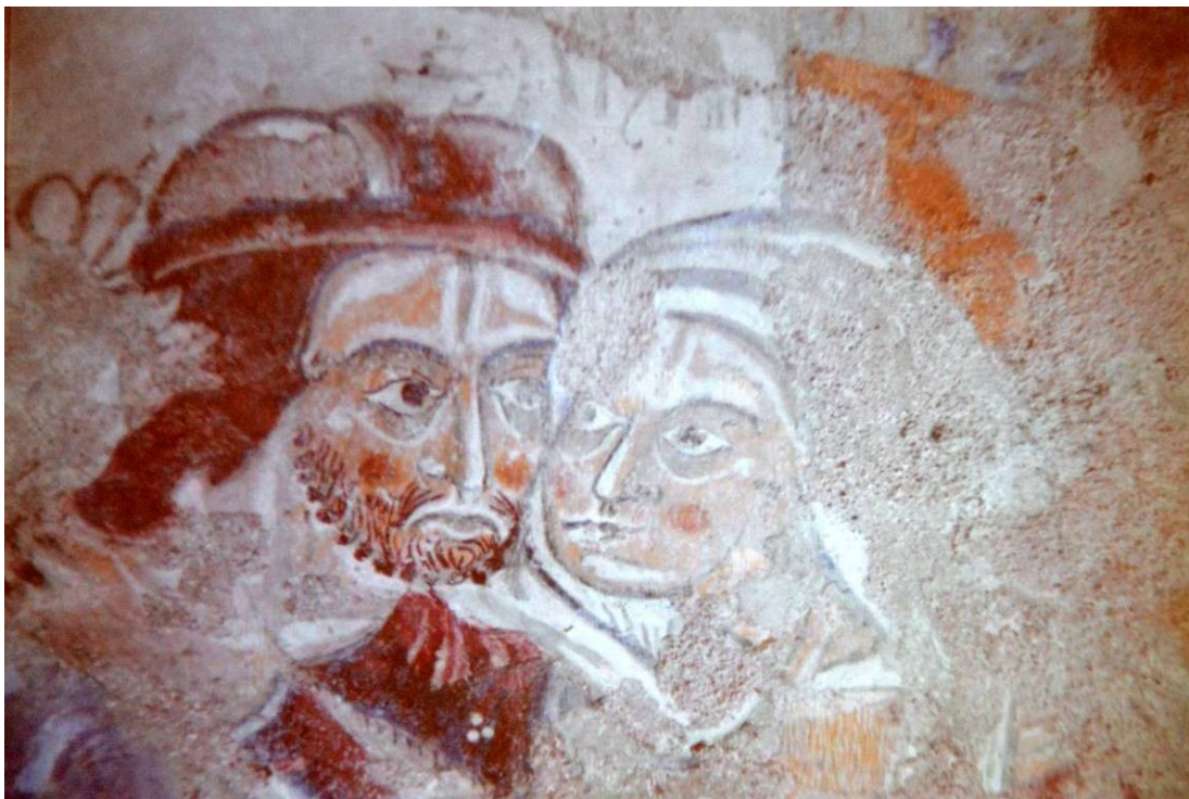
Et, la dernière image... rare dans les représentations de la vie, ce témoignage de tendresse.