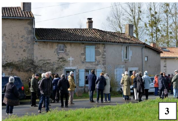
Les visiteurs heureux de découvrir la partie haute du village.