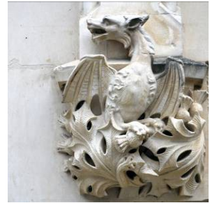
Autres motifs sculptés signes extérieurs de la richesse du propriétaire bâtisseur.