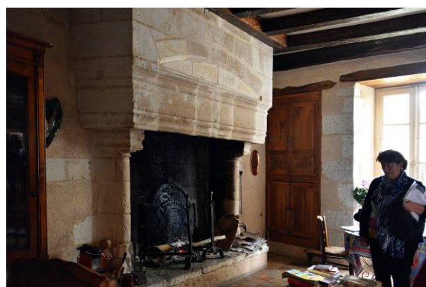
Deux belles cheminées.