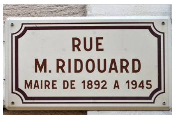
Clin d'œil vers une famille d'adhérents bien connue.

Remerciements aux personnes qui ont préparé cette journée de découverte de notre patrimoine local.