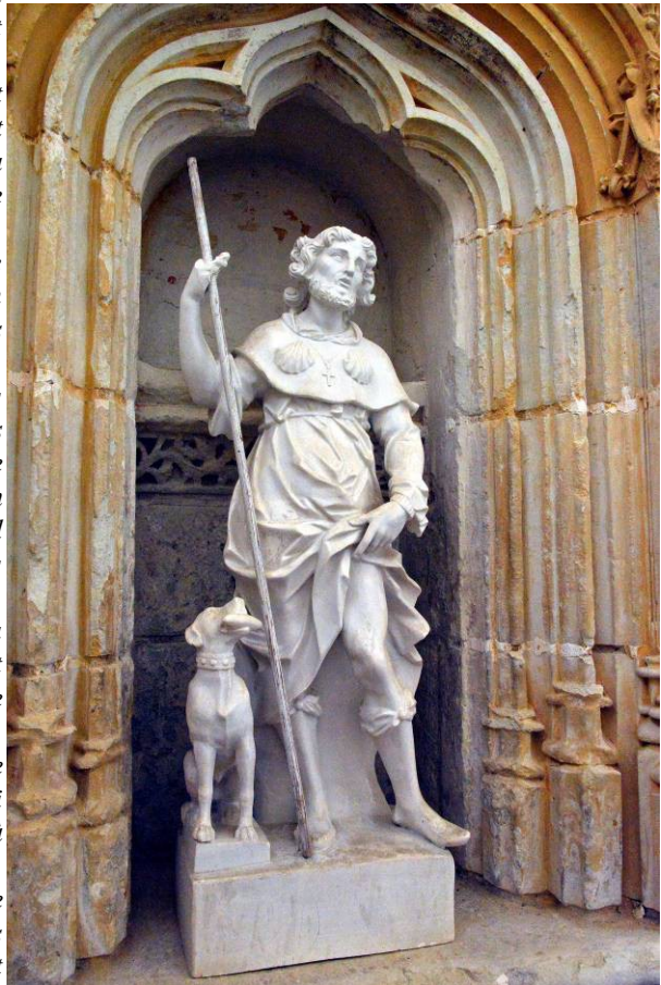
Représentation de Saint Roch.

Cependant, alors qu'il traverse le Duché de Milan où se joue une guerre entre le pape Urbain V et le duc de Milan, il est pris pour un espion chrétien par les troupes du duc, arrêté et emprisonné à Voghera. Alors qu'il pourrait révéler son identité et être immédiatement libéré, il respecte le vœu d'anonymat qui incombe au pèlerin et demeure dans son cachot. Il y reste pendant cinq ans et y meurt vers 1379. D'abord enterrées sur place, ses reliques sont exhumées et transférées à l'église Saint-Roch de Venise.