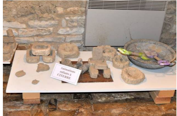
Matériels utilisés pour le travail de la terre et travaux d'élèves.