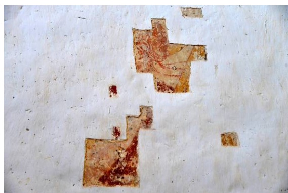
Sondage pour les fresques