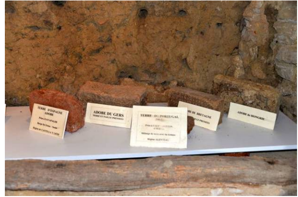
Echantillons de terres selon les régions ou les pays.