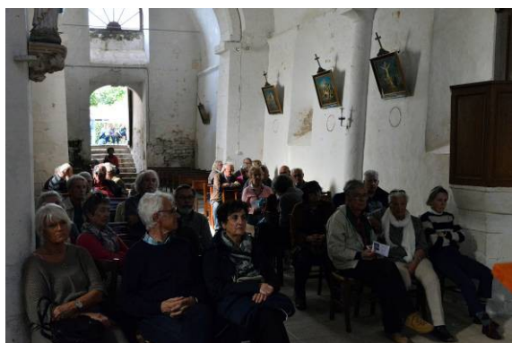
Intérieur de l'église pour écouter l'histoire des poitevins partis vers l'Acadie.