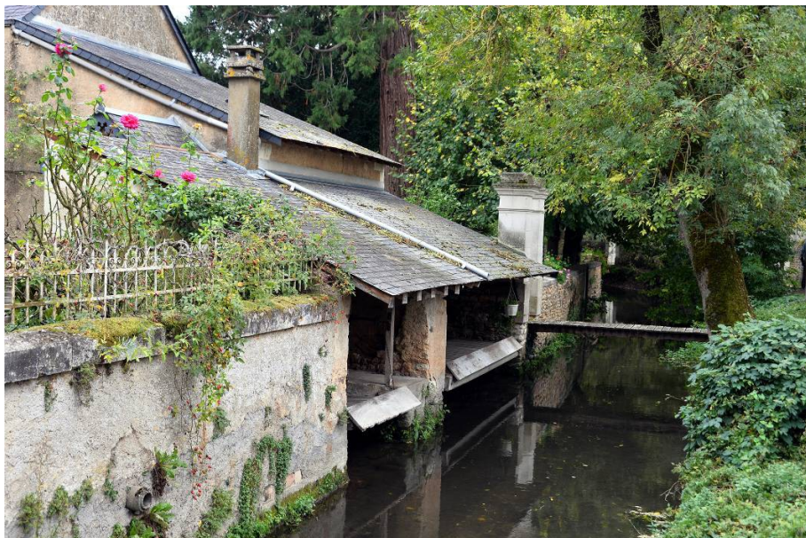
Lavoirs sur la Dive