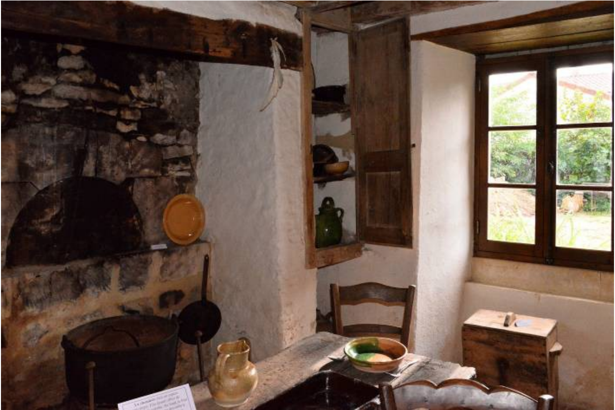
Reconstitution d'un intérieur paysan dans une maison en terre.