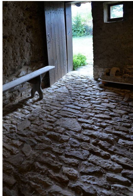
Pavage à l'ancienne.