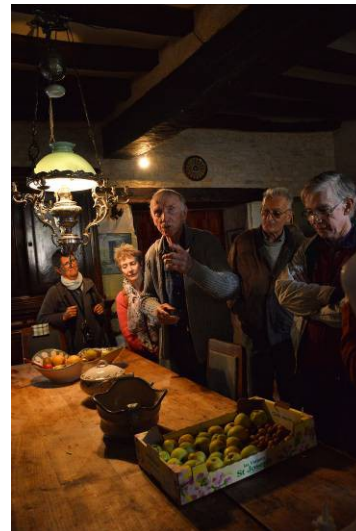
Atmosphère en clair-obscur dans cette grande cuisine aux murs épais.