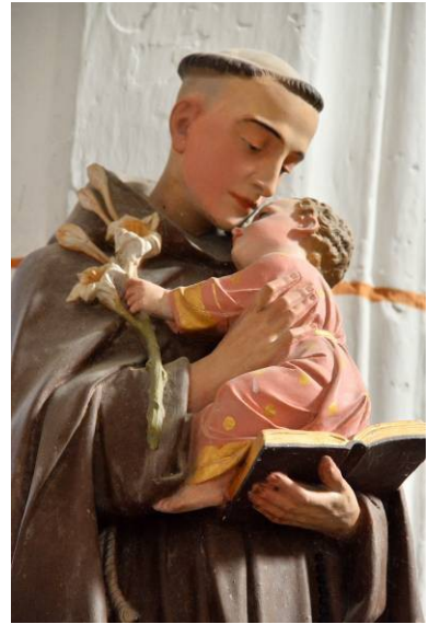
Trois des statues présentes dans l'église où s'expriment l'amour et la tendresse envers l'enfant Jésus.