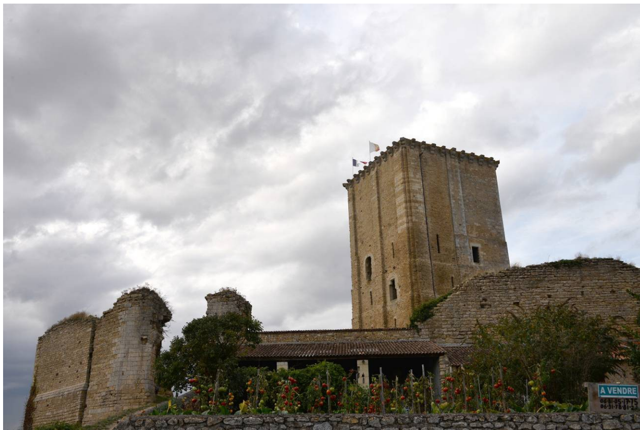
Le donjon de Moncontour sous un ciel chargé de nuages annonciateurs de pluie.

Ancienne forteresse construite vers 1040 par Foulques Nerra (965/970 - 1040), le donjon de Moncontour des XII e et XV e siècles est classé au titre des monuments historiques depuis 1877. Les vestiges du château et de l'église sont inscrits comme monument historique depuis 1995. Le donjon a subi de nombreux sièges. La toiture a été reconstituée dans le cadre de la restauration ainsi que l'escalier intégré dans l'épaisseur des murs. La vue depuis le sommet est superbe. D'autres éléments de défense sont encore visibles : mâchicoulis, bretèches, meurtrières ; fragments d'enceinte XII e et XIV e siècles. Une légende raconte que le donjon aurait été élevé en un jour par la fée Mélusine.