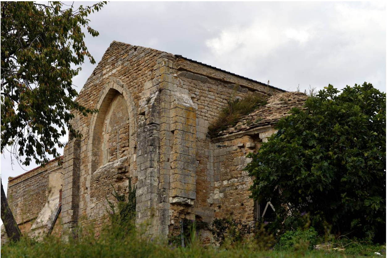
Vestiges de l'église, à proximité du donjon de Moncontour.