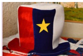
Chapeau aux couleurs de l'Acadie.