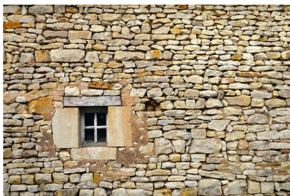
Détail d'un mur de bâtiment agricole.