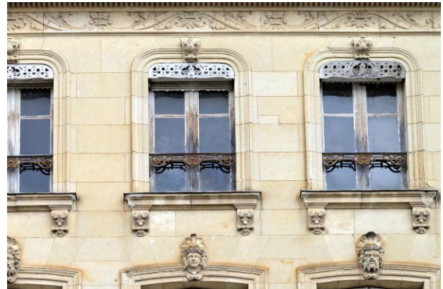
La plupart de ces belles maisons bourgeoises sont en tuffeau et richement ornées de sculptures.