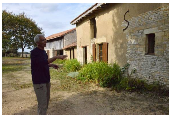
Nos deux guides pour la visite de Terra Villa.