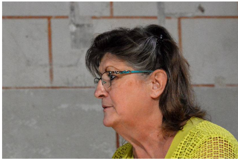
Mme la présidente de la Maison de l'Acadie et Mme Servant, trésorière.

Pour compléter les informations qui nous ont été données, nous sommes invités à aller dans la maison de l'Acadie, petit musée local tout proche où nous nous procurons des brochures éditées par l'association, façon pour nous d'apporter notre soutien aux bénévoles qui se sont rendus disponibles en ce dimanche pour partager avec nous leur passion pour l'histoire.