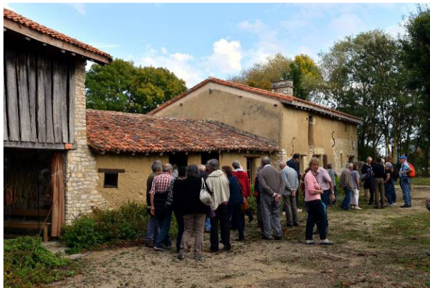
Les visites des salles se font par petits groupes.