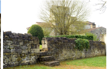
Mur de pierres