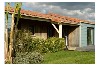
« Le Petit Moulin » et sa roue