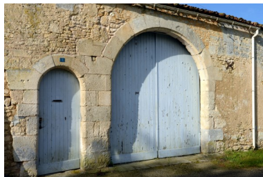
Logis de Ponthieu