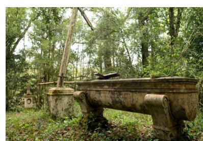
La chapelle et le cimetière des sœurs

En passant par « La Vignolerie », nous arrivons au « Petit Moulin », très beau site magnifiquement restauré et devenu grand gîte pour accueil d'étrangers. La propriétaire nous accueille et nous fait visiter, l'extérieur avec la roue à aubes et l'intérieur avec l'eau passant sous la maison. Merci pour l'accueil, les boissons et les petits gâteaux.