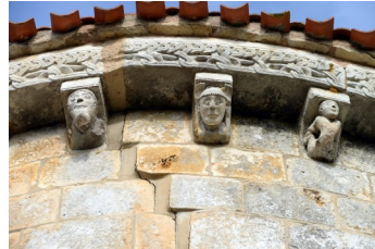
L'homme à barbe L'acrobate