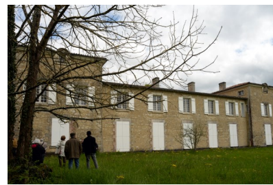
« Château Gaillard »