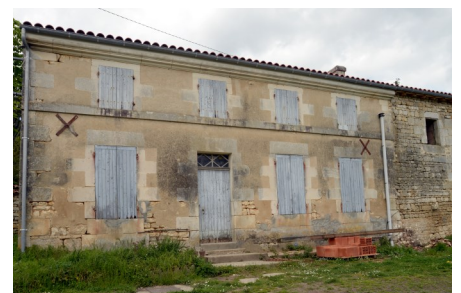
Maison des Blanchardières