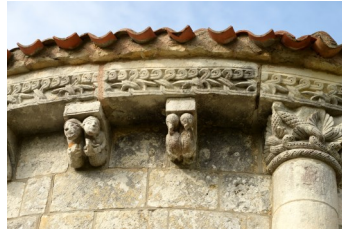
Les moines Les oisillons