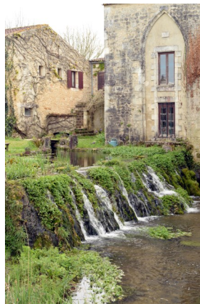
Moulin de La Rutelière