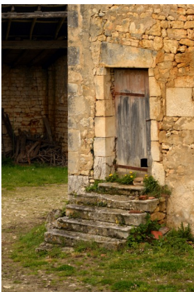
Escalier de pierres

Puis nous faisons le tour du village en remarquant les particularités des maisons, ainsi que le logis de Pontieux. Nous nous acheminons vers le moulin de la Rutelière, datant de 1535, ayant appartenu aux chanoines de Taillebourg, Ce site racheté par la commune a été restauré pour en faire la Mairie. M. Boizumault, maire nous y reçoit pour nous présenter sa commune, il nous fait le récit des transformations, puis aidé de ses adjoints nous offre un copieux apéritif.