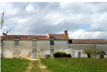
« Le Maine Moreau et sa fuie »

Puis nous reprenons le chemin des « Blanchardières » où nous nous arrêtons voir la maison qu'un adhérent restaure.