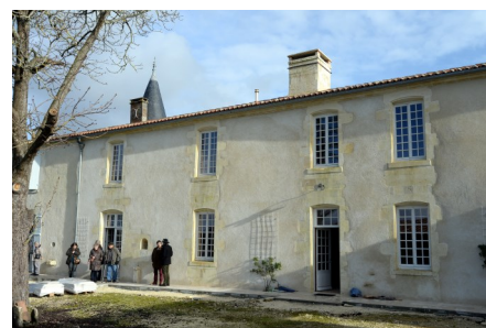
La façade côté cour