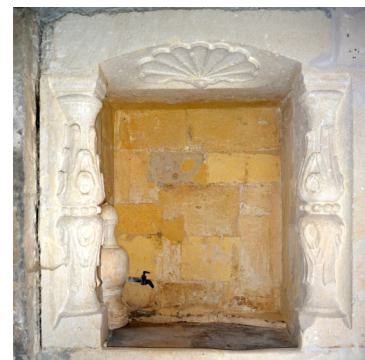
L'évier avec aiguière