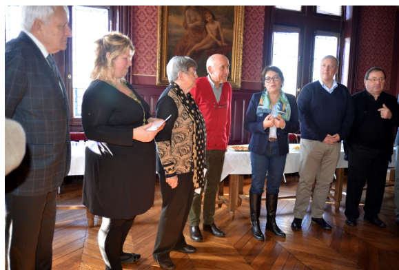
Les officiels lors de la cérémonie