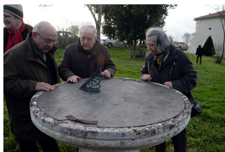
le cadran solaire