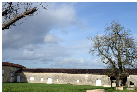
Les anciens chais