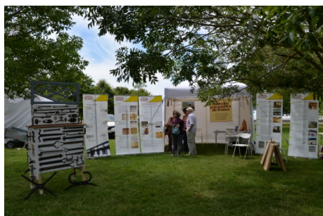
Stand MPF à Talmont-sur-Gironde lors des journées du patrimoine de pays (22/23 juin 2019).

51 rue de la Garousserie - Les Granges 17400 Saint-Jean-d'Angély 06 56 71 44 74 - 05 46 32 03 20 charente-maritime@maisons-paysannes.org (ouvert le mercredi après-midi)