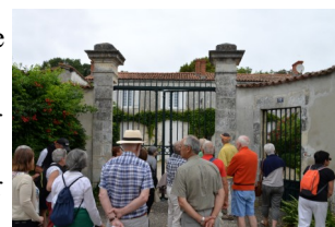
Devant la grille de La Ramée.

C'est là que prend fin notre promenade qui, à leurs dires, a ravi les adhérents venus nous rejoindre en Aunis.