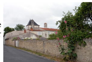
Le Logis du Vivier.

En raison de ses murs élevés, nous ne distinguons rien du très vieux Logis du Vivier.