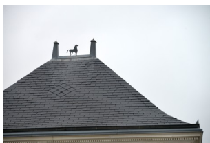
Toiture du "Petit Château".

Rue de La Rochelle, puis rue des écoles : D'un côté de la rue, une maison attire l'attention, c'est la seule du bourg avec un toit d'ardoises ; malgré son appellation de "petit château", elle n'a jamais appartenu à un châtelain !