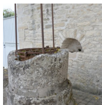
Le puits avec le déversoir inséré dans le mur de clôture.