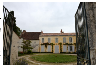
Le Logis de Bois Not.