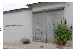
Portail, rue de Parthenay.