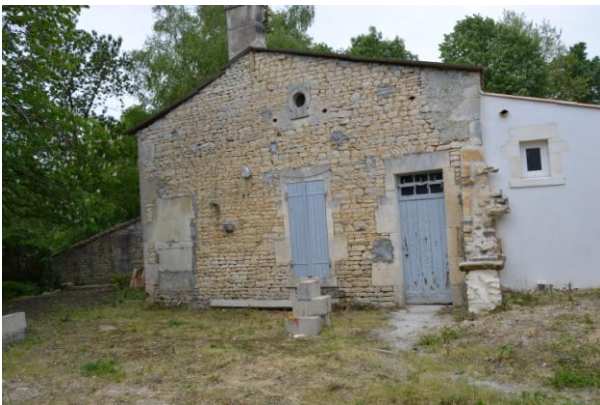
Cette maison de pays comporte une porte à imposte à lame pleine. La porte possède en partie basse une planche horizontale dite planche à pourrir. La peinture bleue des huisseries est traditionnelle.