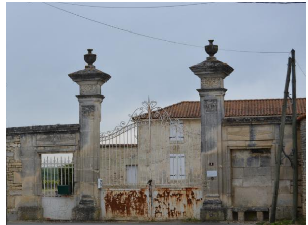
Portail avec grille en fer. On trouve deux portes une pouvant être ouverte et l'autre murée (la porte des morts) ou de façon plus prosaïque pour obtenir une symétrie de construction. A noter la présence d'un banc en pierre. Les chapiteaux des pilastres sont de style composite.