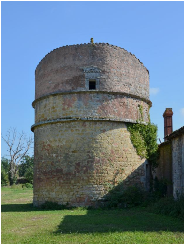
Pigeonnier du château Chesnel à Cherves-Richemont

Prix « coup de cœur » du jury : « Village Gabarier »