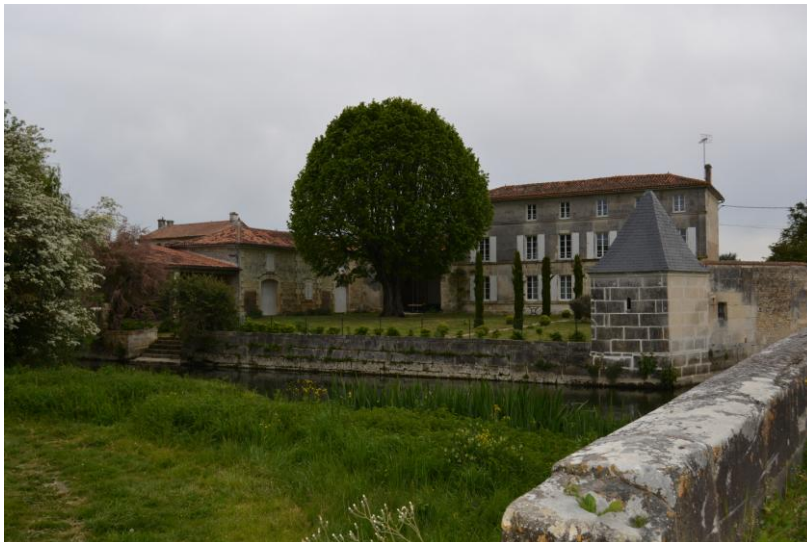
Maison de maître accompagnée de ces bâtiments annexes : un bâtiment en pavillon au toit d'ardoises et des granges écuries.