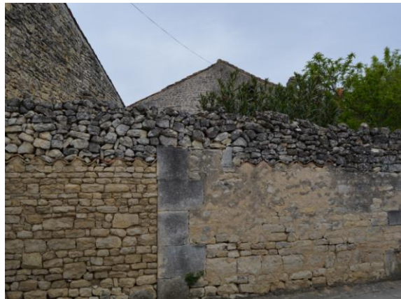
Mur en moellons. A droite du chaînage mur recouvert d'un enduit, à gauche différents appareils de moellons. A noter « l'empilement » de moellons alors que le muret semblait fini (réhaussement).