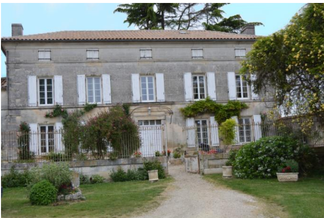
Cette maison charentaise est sur 3 niveaux : - le rez-de-chaussée avec une porte centrale à imposte - un premier étage - les combles à grand surcroît. Chaque niveau est délimité par un bandeau saillant en pierre. La composition de la façade est symétrique.